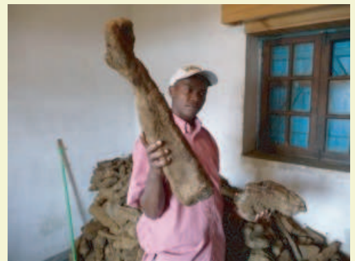
Ce n'est pas une branche mais un tubercule d'igname !

Pour en savoir plus sur ce volet, n'hésitez pas à vous rendre sur notre site internet : www.vozama.org