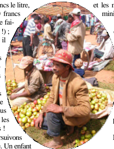
Photo : scène de marché à Fianarantsoa

Dites-le à tous vos amis ! BONNE et HEUREUSE ANNEE 2005 !