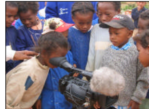
Une caméra dans les postes VOZAMA, quelles découvertes...