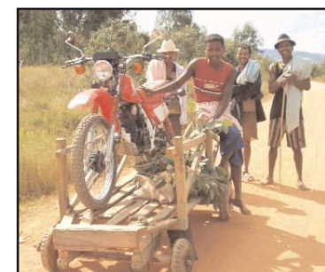
Dépannage de la moto de l'inspecteur

Les inspecteurs coordonnateurs et régionaux sont engagés à plein temps, ils ont leur pied à terre dans les bureaux régionaux et partent tous les matins à moto en service commandé par la directrice de région et le chef du personnel. Missions spéciales de