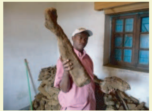
Ce n'est pas une branche mais un tubercule d'igname !

Pour en savoir plus sur ce volet, n'hésitez pas à vous rendre sur notre site internet : www.vozama.org