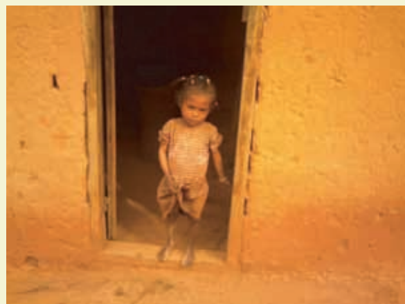
A 10 ans cette fille ne pèse que 10 kg

Pour nous aider à venir en aide à ces enfants, cliquez sur ce lien.