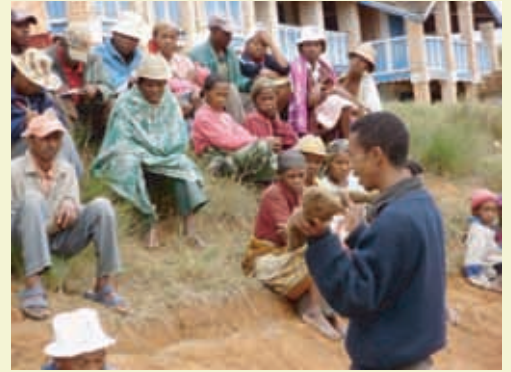
Promotion de la culture de l'igname auprès des parents

Soutenez les actions de Vozama en téléchargeant notre bulletin de soutien sur notre site internet www.vozama.org